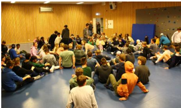
Bilete: Her er ca alle på leiren i eit og same rom!