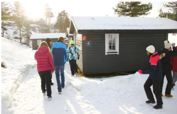
Bilete: På laurdagen var det gruppekurransar ute. Her er ein gjeng på telletur.

Crossroad var virkeleg toppen av toppen! Heile 90 ungdommar fylte huset med mykje latter og god stemning! Det heile starta virkeleg med eit konfetti-smell frå det fantastiske lyd og lysanlegget som var rigga. Helga var fylt med alt i frå brettspel til gymsal, aking, ski og bading, gode møter, seminar og ikkje minst fantastisk lovsang med bandet!