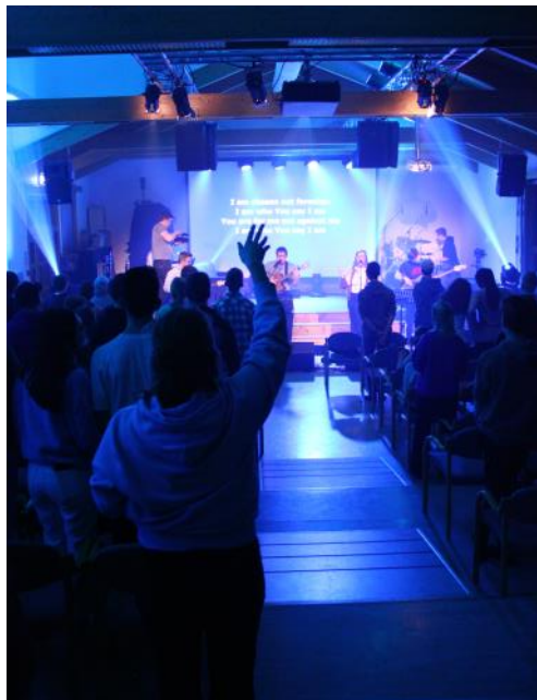
Bilete: Ei flott lovsongsstund.