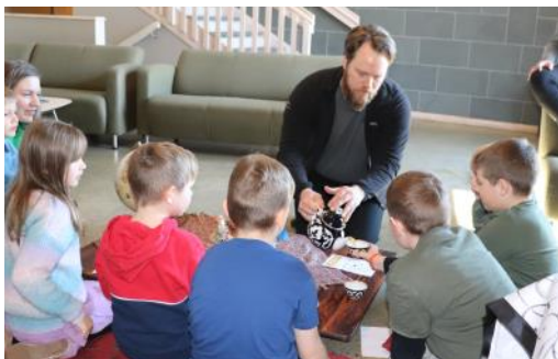
Bilete: her blir borna servert te på Aserbajdsjansk vis.

Søndag 26.mars var tid for Smak&Sjå på Lyngmo! Det er ein misjonsdag for barn, og målet er å inspirere barna til å vere nysgjerrig på andre kulturar og kjenne på Guds hjarte for alle folkeslag! Gud elsker alle mennesker, uansett kvar me er, og me kan sjå glimt om kven Gud er i alle dei ulike kulturane. I år kunne barna besøke ulike rom som fortalte om kultur, tru og smak frå Sentral-Asia, Sør-Amerika, Papa Ny Guniea, Noreg og Øst-Afrika. Etter tid i grupper i alle rommene,